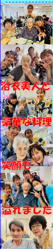
浴衣美人と 豪華な料理 笑顔も 溢れました

八月二十七日(火) バイキングを行いました。今回は、清涼感たっぷりな「すだちうどん」民宿中村屋の御主人様から味付けを教えて頂いた【サザエご飯】そして、職員が炎天下の中、汗を流しながら焼いた【大地鶏の炭火焼き】でした。すだちが一面に広がったうどんは見ているだけで涼しく、味の染み込んだサザエご飯もほっぺが落ちそう。鶏油を掛けながら焼いた地鶏は火柱を上げてより一層香ばしくなっています。会場全体で『ファイヤー』の掛け声で大いに楽しめました。五感で楽しめるバイキングとなりました。