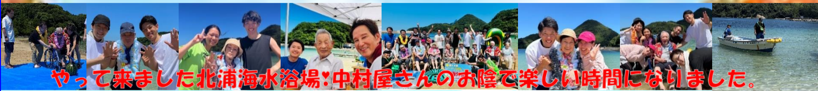
やって来ました北浦海水浴場!中村屋さんのお陰で楽しい時間になりました。

8月1日(木) 毎年恒例のうみ外出へ行って来ました。今年も北浦海水浴場の中村屋さんにお世話になりました。サザエご飯のおにぎり、ところてん、かき氷等を食べ、『海もかき氷も何十年振りだわ!』と喜ばれる御利用者様。海に足をつけ、最後はスイカ割りで大盛り上がり。笑顔一杯の最高の夏の思い出となりました。