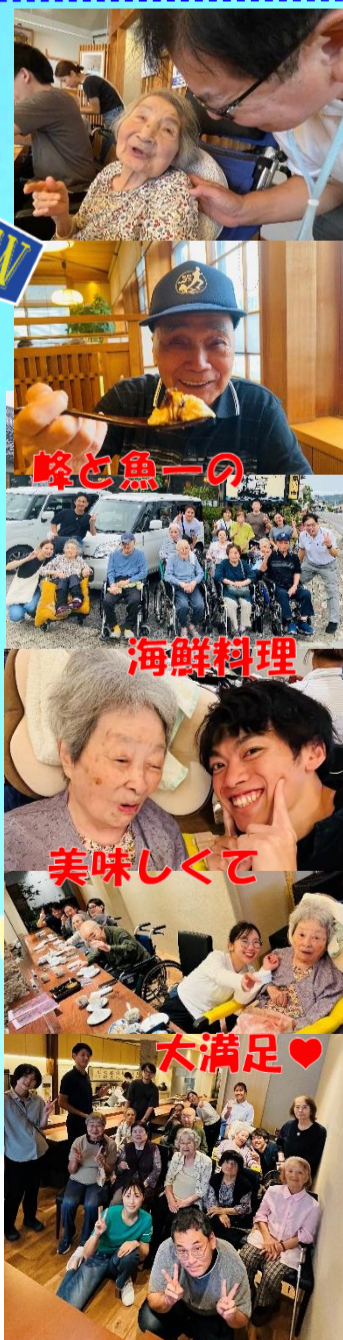
魚と海の 海鮮料理 美味しくて 大満足♡

八月二十九日(木)・三十日(金) 七月・八月生まれの誕生者合同で【誕生者外出】を行いました。日程により場所を変え、境港市の【お食事処 峰】と松江市内の【魚一】に行かせて頂きました。どちらのお店も味は最高!どちらかを選ばれても大満足な外出でした。見た目も綺麗で食欲を掻き立てられました。お食事の品数も多く、量もありましたが、完食される方がほとんどでした。暑いと食事も喉を通り難くなりますが、お話しも弾みながら楽しくお食事が出来ました。