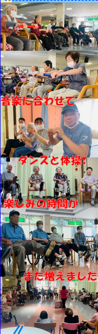
音楽に合わせて ダンスと体操! 楽しみの時間が また増えました

八月から新しいアクティビティサークルが始まりました!初回はダンスや体操、脳トレトレーニングなどすっかりと身体を動かし、間ではティータムを挟み水分補給も行いました。今後とも園芸や制作、レクリエーションなど季節に合わせた活動を幅広く行っていきますので、楽しみにして下さいね♡